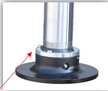
MAALEVY ASENNETTU SYLINTERIIN PULTEILLA