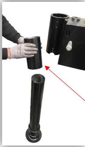
PIPE LOCK SYSTEMI